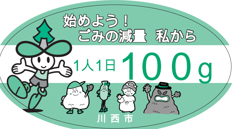
キャラクター紹介 左からエコちゃん、ぶっくろごみくん、スリムちゃん、クリンちゃん、ぶっくろモンスター

東谷小学校の4年生が「ごみ学習会」で、ごみ減量のアイデアを考えて実際に取り組みました。子ども達のアイデアを原文のまま載せています。