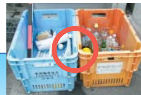
(青色の回収容器) その他のガラス類 (オレンジ色の回収容器) 食品関係のビン