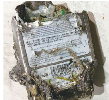
↑ 発火の原因となって 焼けたリチウムイオン電池

国崎クリーンセンターへ搬入された大型ごみや、燃やさないごみに混入しているリチウムイオン電池は、ごみ処理の工程で破砕機によって砕かれます。その際に火花が発生し、燃えやすいものに引火することで、ごみ処理場内での発火が急増しています。 充電できる家電、おもちゃ等は、できるだけリチウムイオン電池と分別して出してください。モバイルバッテリー等分解できないものは、そのまま店頭回収ボックス、店頭カウンター等での処分にご協力をお願いします。