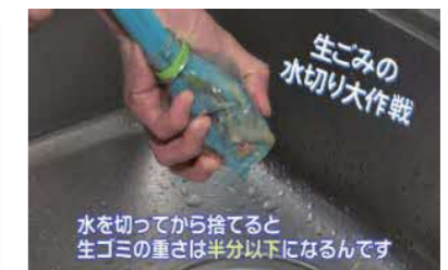
水を切ってから捨てる 生ゴミの重さは半分以下になるんです