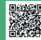
市ホームページ掲載 ごみ減量啓発動画

他にも、ごみ減量啓発動画を制作しましたのでご覧いただき、ごみ減量の参考にしてください。