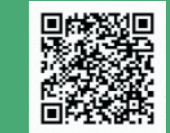
市ホームページ掲載 ごみ分別アプリ詳細

スマートフォンアプリのLINEでも、ごみカレンダーや分別基準などが確認できるようになりました!さらに、地域登録をすると、ごみ排出日の前日19時に、翌日かどのごみの排出日なのかをLINE通知します!登録方法など詳しくは、市ホームページで確認してください。