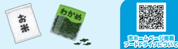
市ホームページ掲載 フードドライブについて

市では、イオンフードスタイル川西店とKOHYO川西店に、「毎月第3月曜日から1週間」食品回収用BOXを設置しています。回収した食品は、市社会福祉協議会を通じてこども食堂など必要なところへ配布されます。ご家庭で食べきれない食品がありましたら、ぜひ食品回収用BOXへお持ちください。食品回収用BOXへ入れていただく食品の基準など、詳しくは市ホームページをご覧ください。