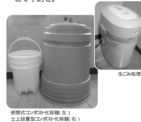
密閉式コンポスト化容器(左) 土上設置型コンポスト化容器(右)