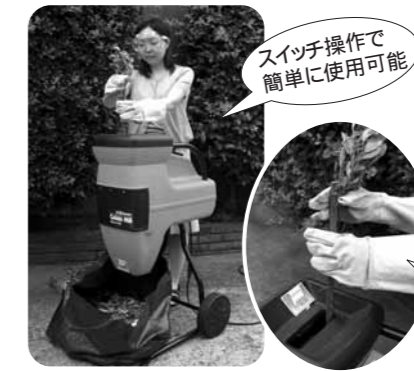
スイッチ操作で簡単に使用可能