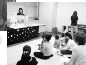
学習会を親子で受講