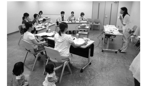
第1回会議 皆さんちょっと緊張気味