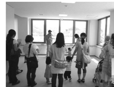
国崎クリーンセンターを見学中