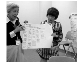
和気あいあいと話し合い