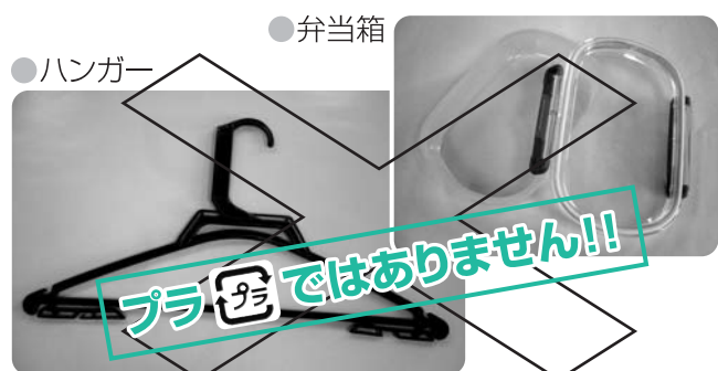
※燃やすごみ(40cm以上は大型ごみ)