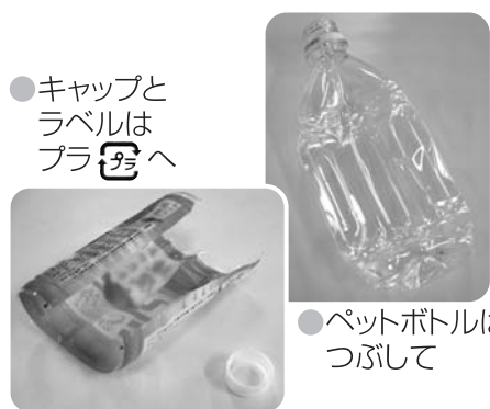
●キャップとラベルはプラへ

ペットボトルとプラは、それぞれ別に処理されます。キャップとラベルはプラへ、ボトル本体はペットボトルに分けて出しましょう。