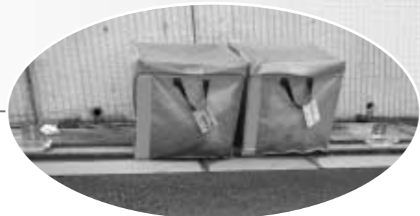
地域でプレートを掲示した回収ボックスを設置

4月以降のごみステーションの状況を見ると、回収ボックスを設置したり、ネットをかぶせるなど各地域の実情に合わせて環境美化に取り組んでいただいていることが分ります。また、種別の違うごみ袋が混ざらないよう分かりやすく看板を設置するなど工夫しながらご協力いただいています。そして、地域の皆さんから「ごみを出さないようがんばっています」というお声をいただくことが少なくありません。ごみは、私たちの生活から切り離せないものです。地域や各家庭での協力なくしては、ごみの減量やリサイクルを進めることはできません。今後ともごみの減量にご協力をお願いします。