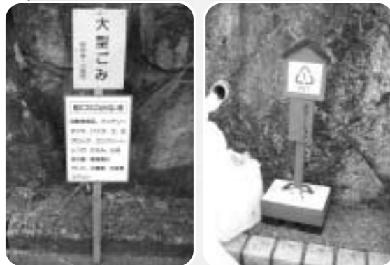
地域オリジナルの手作りの看板