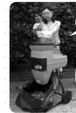
スイッチ操作で簡単に使用可能

市職員が粉碎機を指定場所へ運搬し、使用方法を説明します。返却時の引き取りも行います。