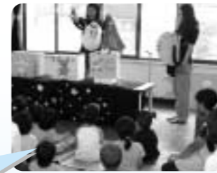
自治会や親子サークルなどで気軽にお申し込みください