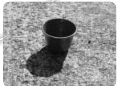
8 植木鉢(プラスチック製)