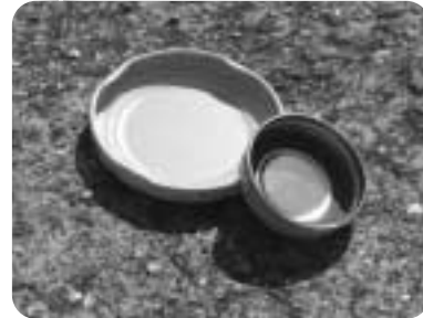
3 ビンのふた(金属製)