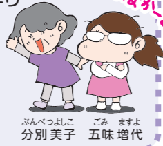
ぶんべつよしこ 分別美子 ごみ ますよ 五味増代