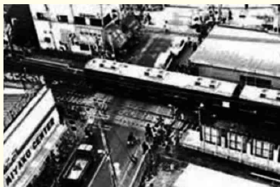
旧・川西能勢口駅周辺

明治39 (1906) 年、「箕面有馬電気鉄道株式会社」が設立された際、その本社は川西にありました。いくつかの社名変更を経