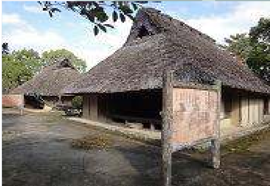
一庫ダム 歴史民俗資料館