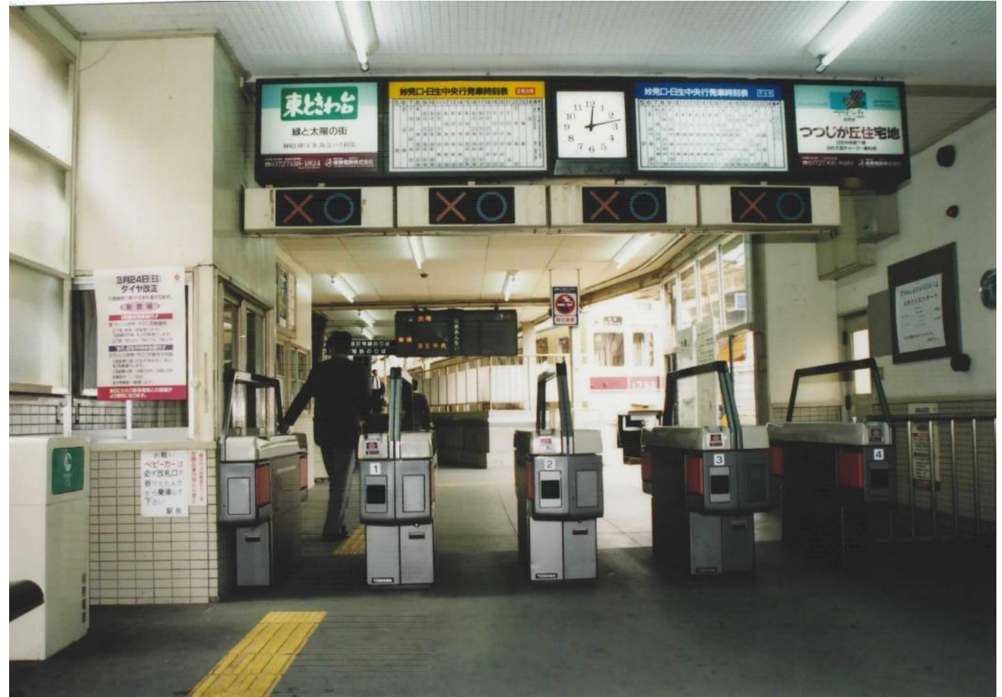
高架になる前の能勢電鉄川西能勢口駅の改札です。 昔の改札は一方通行だったので、上に○×の表示がついていました。 11