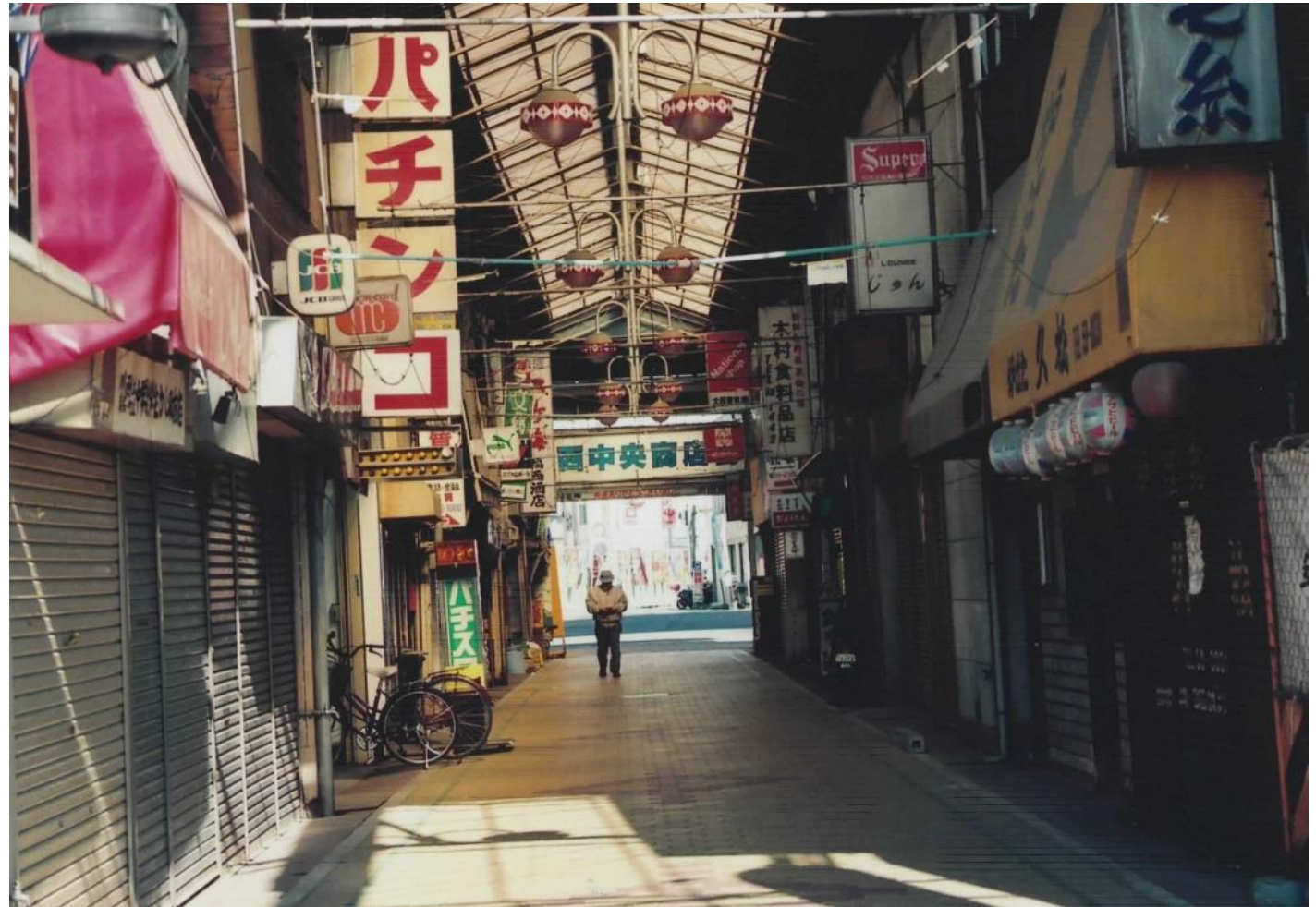
現在は藤の木通りになっています。