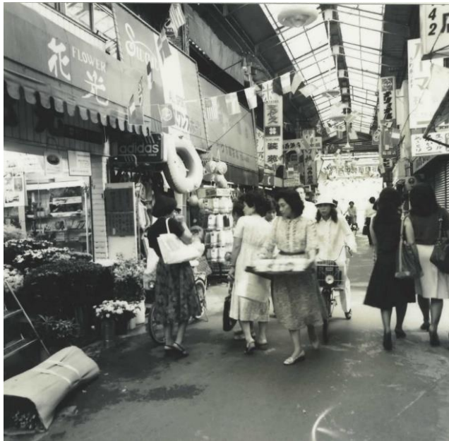
かつての商店街の様子