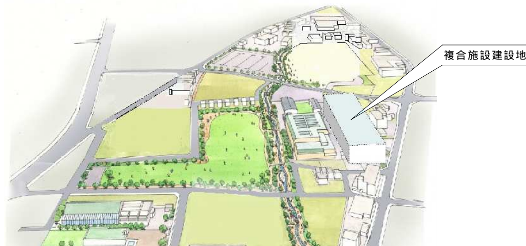
中央北地区特定土地区画整理事業 複合施設サイトイメージ図