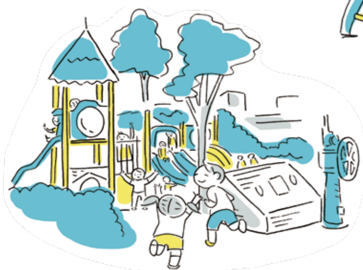
市街地でも元気に遊べる暮らし