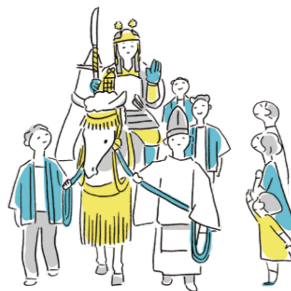
ふるさとの歴史にふれる暮らし