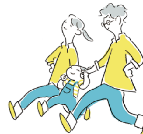
ファミリー層が住んでみたいと思える暮らし