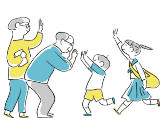
また帰ってきたいと思える暮らし