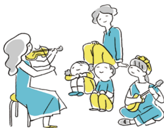
まちのにぎわいを感じる暮らし