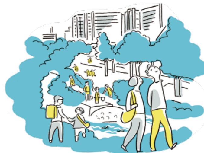
良質な住環境がある暮らし

まちのいいところが、普段の生活で感じられる“かわにしの暮らし”。 そんな暮らしが続いていくことで、まちへの愛着が育まれ、 “心地よい”ずっと住んでいたいまちになります。 そこに暮らす皆さんが、まちのいいところを共有できていることが大切です。