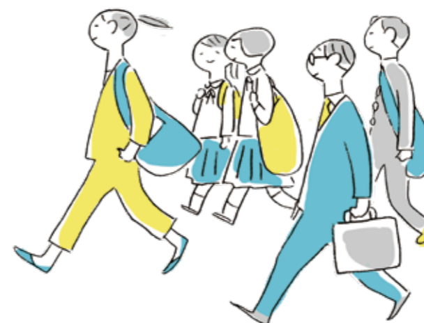
大都市への利便性が高い暮らし