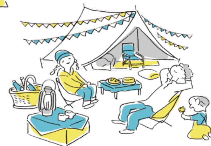
豊かな自然が身近な暮らし