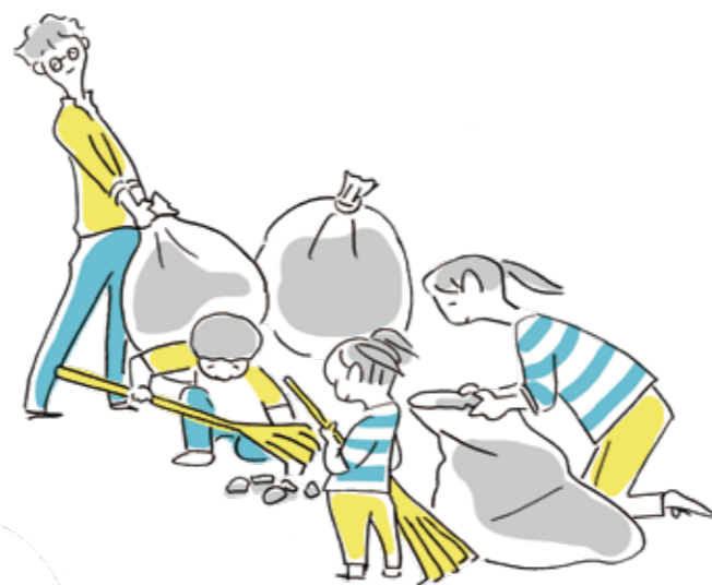
地域をみんなで大切にする暮らし