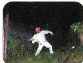
動物駆逐用煙火(轟音玉)を投げる

花火、爆竹などで行います。クマの追い払いは危険が伴います。市役所や町役場と相談の上、万全の安全を確保して行ってください。状況により森林動物研究センターが追い払いを実施します。