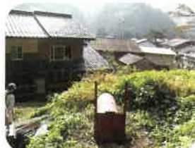
ドラム缶オリの設置

できるかぎりの防除や追い払いをしても、効果がない場合は、ドラム缶オリで捕獲します。有害捕獲の実施は市や町が申請しますので、相談してください。