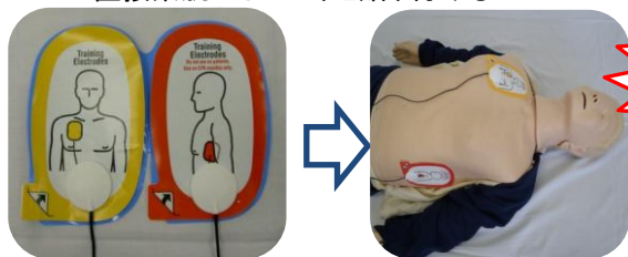
▲成人用電極パッド