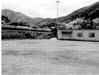
黒川公民館 グラウンド修繕