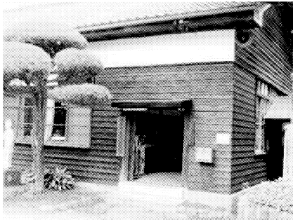
黒川公民館 出入口、外壁修繕