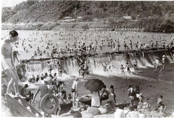
鶯の森駅前の淡水遊泳場「鶯の森遊泳場」