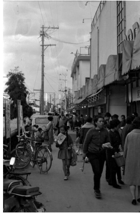
1960年頃川西能勢口駅南側シロ