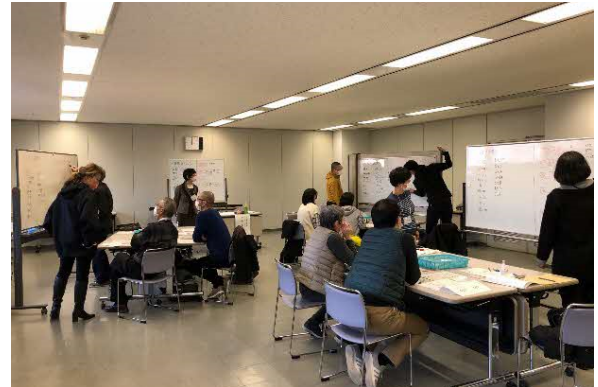
「役割分担会議」で自分ごととして会議に参加