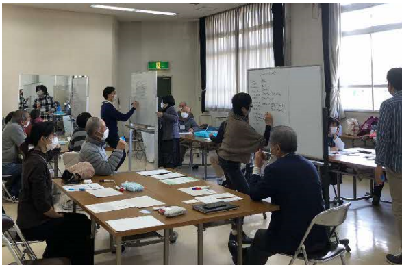
「プロジェクトスタート会議」で 見通しを立てて進めます