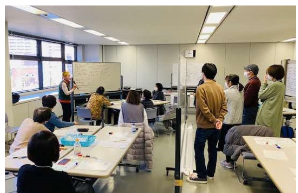
楽しい「新年会」の企画を発表。ホワイト ボードを見ながらだと緊張せずに話せます