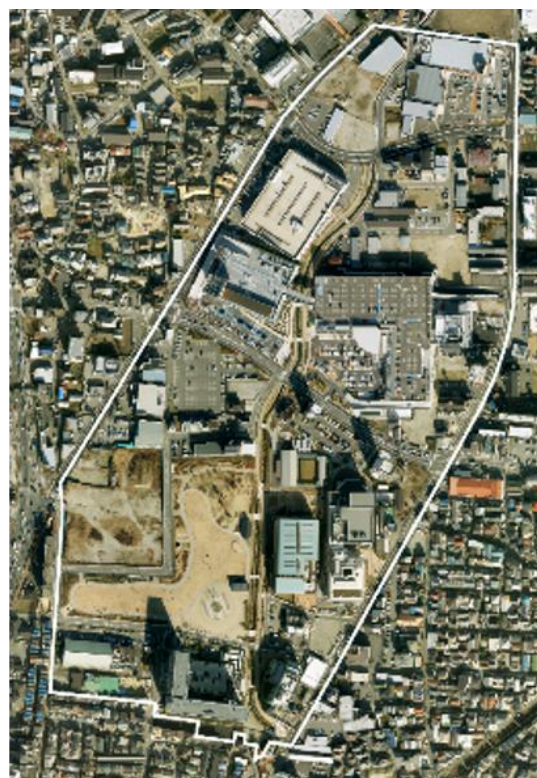
令和元年(2019 年) 都市基盤整備の完成