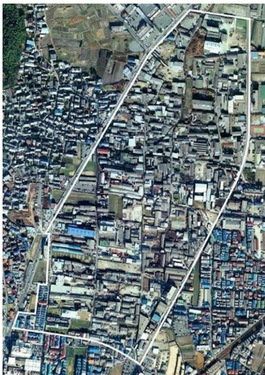
昭和 58 年(1983 年) 最盛期の皮革工場群