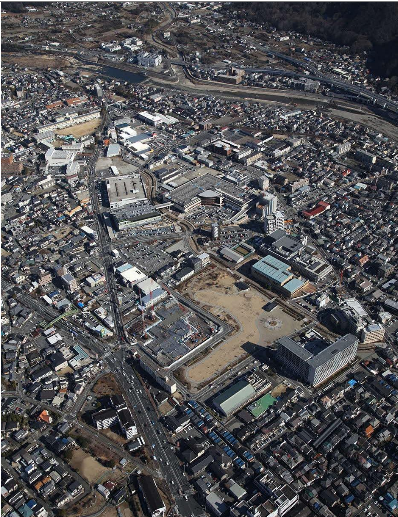
キセラ川西地区全景 令和3年(2021年)1月