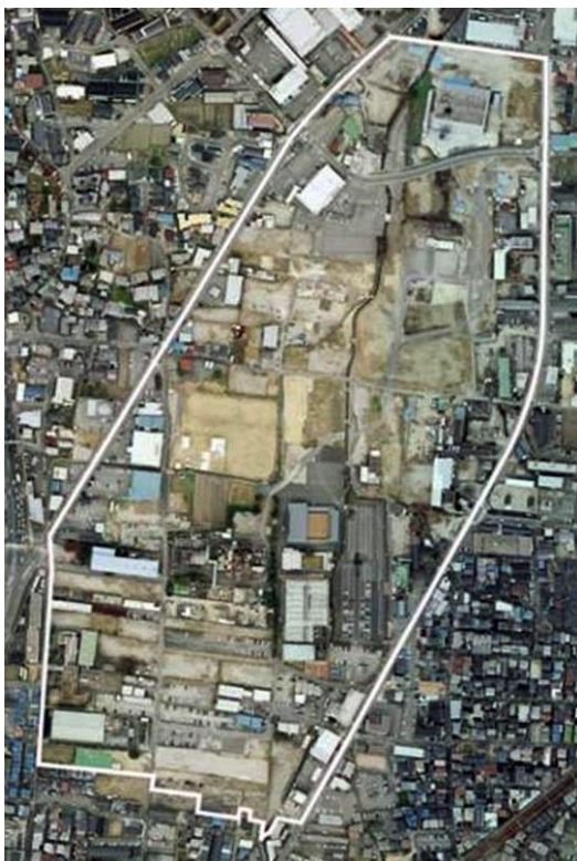
平成 21 年(2009 年) 転廃業事業後