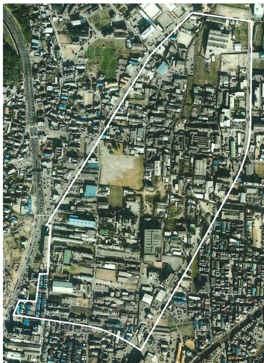
平成 8 年(1996 年) 阪神・淡路大震災後