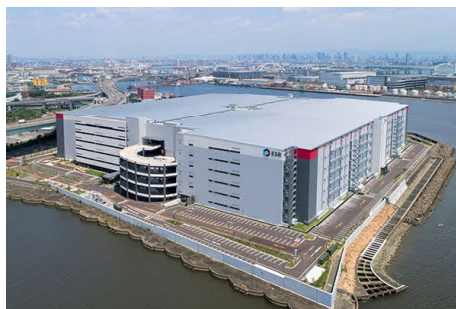
ESR 尼崎 DC